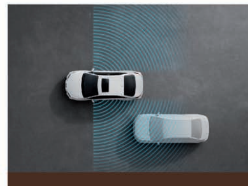
Alerta de punto ciego (BSM)

*Toyota Safety Sense, integra diferentes sistemas de seguridad activa que pueden variar según cada modelo y/o versión. A su vez, estos sistemas están diseñados para asistir al conductor, no para sustituirlo. El conductor debe mantener en todo momento el control de su vehículo y es responsable de su conducción, por cuanto estos sistemas no reemplazan la conducción segura. El correcto funcionamiento del Toyota Safety Sense y de los distintos tipos de sistemas que equipa, depende de muchos factores incluyendo las condiciones del camino, el clima y el vehículo, razón por la cual el/los sistemas podrán verse afectados u obstaculizados debido a factores externos, no siendo Toyota Argentina S.A. responsable de las consecuencias derivadas del uso del sistema. Para más información sobre Toyota Safety Sense, su funcionamiento y sus limitaciones, dirigirse a la web www.toyota.com.ar y/o consulte el manual de usuario.