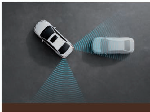
Alerta de tráfico trasero (RCTA)

El Crown pone la seguridad como su principal prioridad. Es por eso que ofrece 8 airbags de serie, control de estabilidad (VSC) con asistencia activa en curvas (ACA), control de tracción (TRC) y ABS con distribución electrónica de frenado (EBD). Para más información acerca del sistema de airbags, ingresá a: www.toyota.com.ar/mi-toyota/sistema-de-airbags