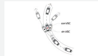
Control de estabilidad (VSC), control de tracción (TRC) y asistente de arranque en pendientes (HAC)