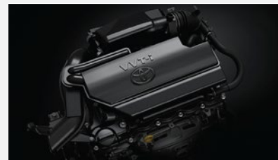
Motor Toyota 2NR-FE, 16 válvulas con sistema Dual VVT-i