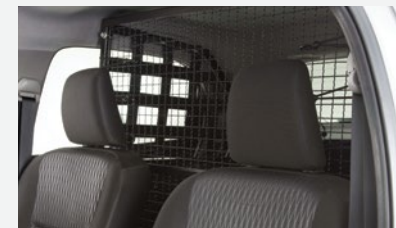
Estructura metálica de carga