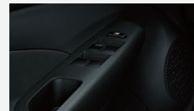
Comando eléctrico en ventanillas delanteras