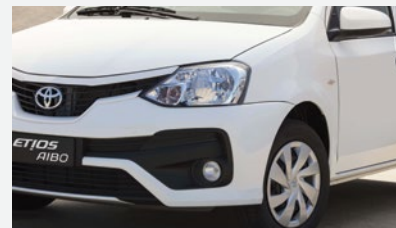
Luces de circulación diurna halógenas (DRL)