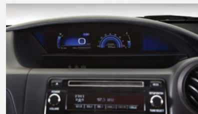
Display de información múltiple digital de 4,2"