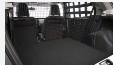
Capacidad máxima de carga de 450 kg.